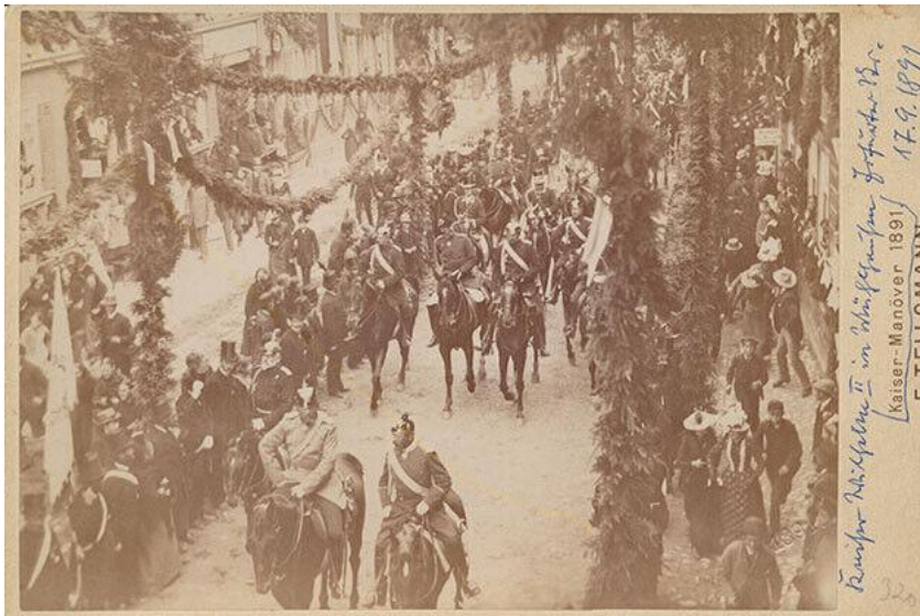
Einzug des Kaisers in Mühlhausen am 17.09.1891 4 . Leider ist auch in der Vergrößerung der Bart nicht zu erkennen.